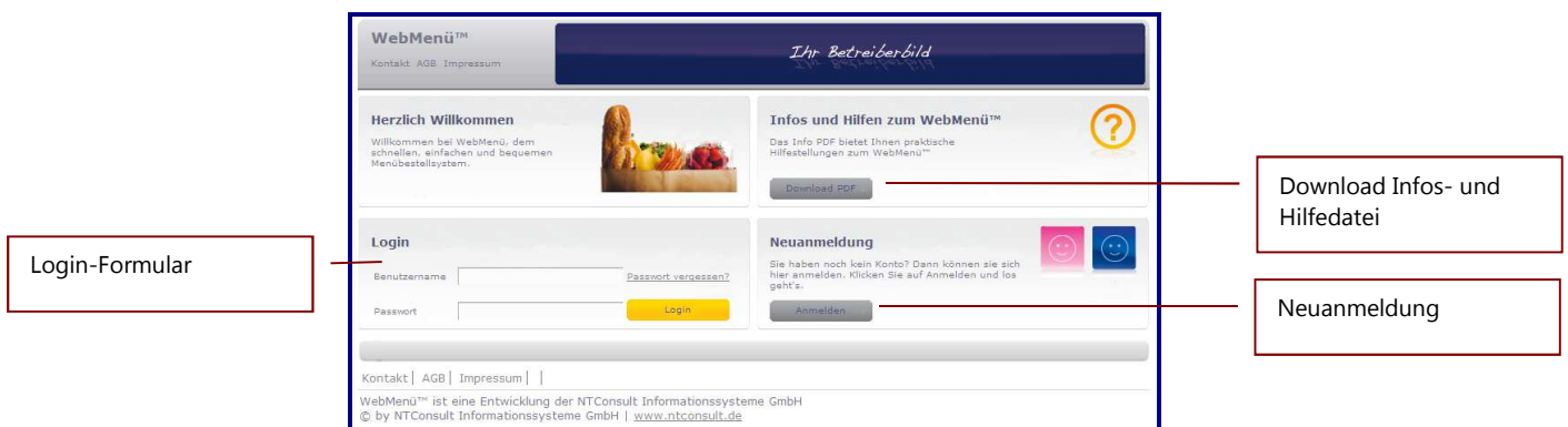
Abb. 3 WebMenü Homepage

Sie gelangen anschließend direkt zur Login-Maske des WebMenüs: