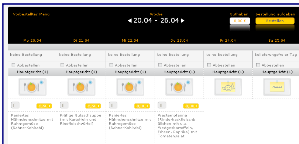
Abb. 1 Internetbestellsystem WebMenü

Ihre Schule hat sich für den Einsatz des Internetbestellsystems WebMenüs entschieden. Nachfolgend möchten wir Ihnen eine erste Übersicht der wichtigsten Informationen und ersten Schritte, die zur Nutzung des WebMenüs erforderlich sind, geben.